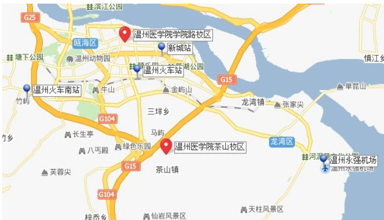
图 1：温州医学院学院路校区、茶山校区方位示意图