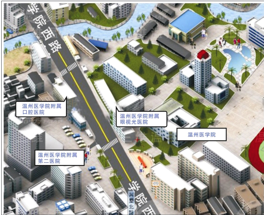
图 2: 温州医学院学院路校区、附二医、附属眼视光医院、附属口腔医院示意图