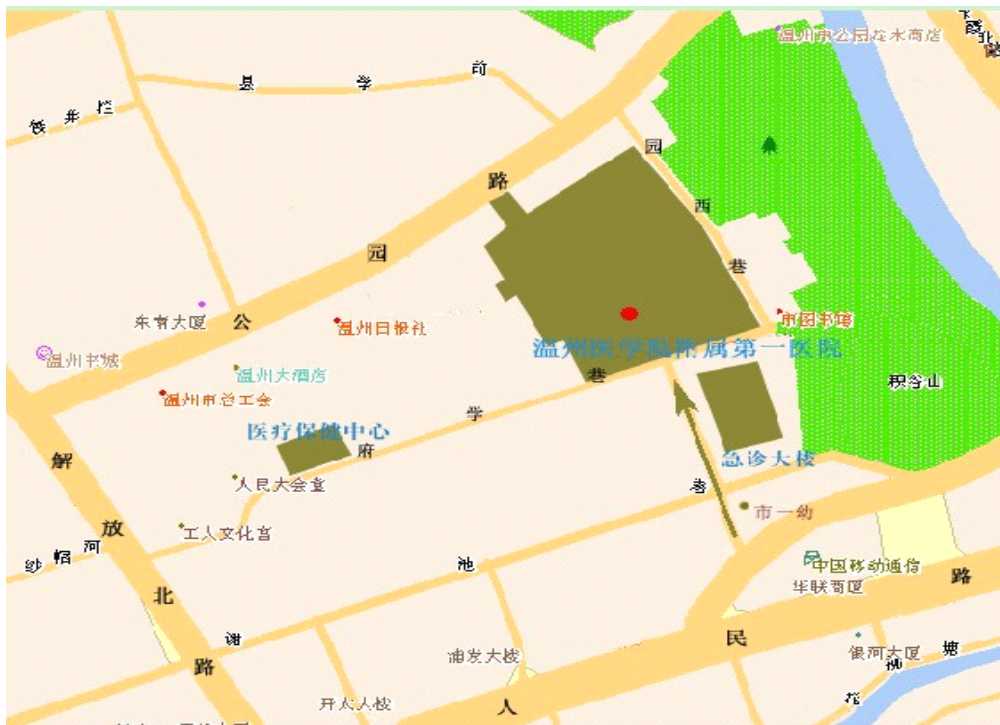
图 3: 温州医学院附属第一医院示意图